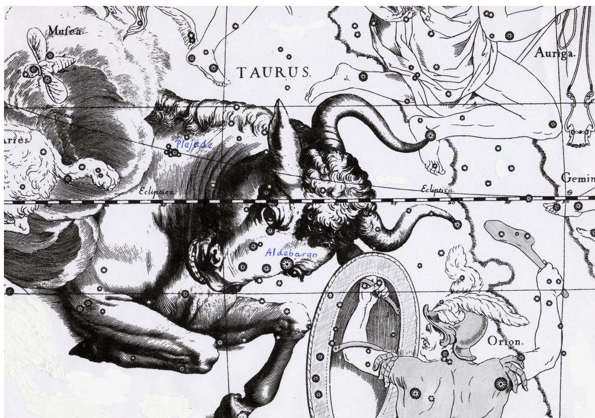
Ozvezdje Bik – Taurus s Plejadami. Iz Hevelijevega atlasa zvezdnega neba Uranografija (1690).

Takšna je torej zimska slika nebesnega Orionovega zasledovanja lepih Plejad. O tem se lahko prepričaš z opazovanjem.