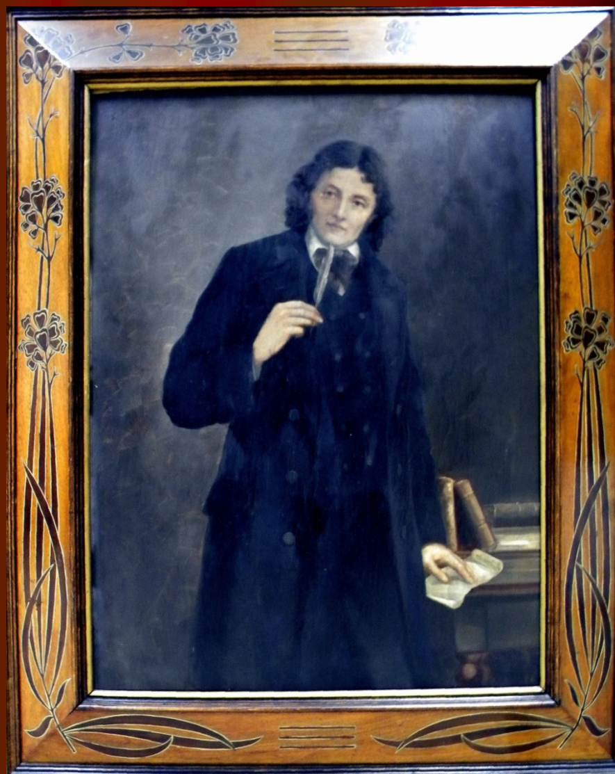
Dr. France Prešeren, olje na platnu.