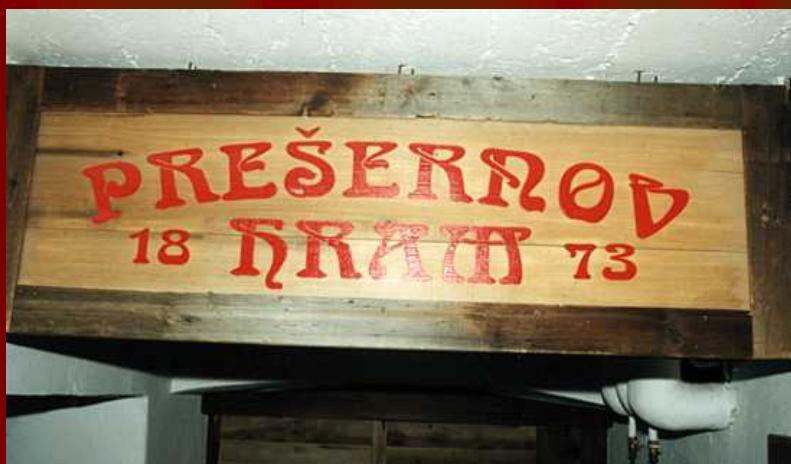
Obnovljena lesena napisna plošča nad vhodom v kletni prostor v današnji gostilni Kunstelj.