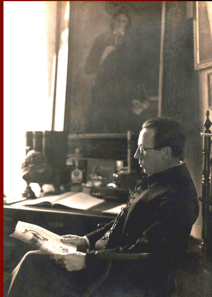
Tudi v Radovljici je bila nad pisalno mizo Prešernova podoba.