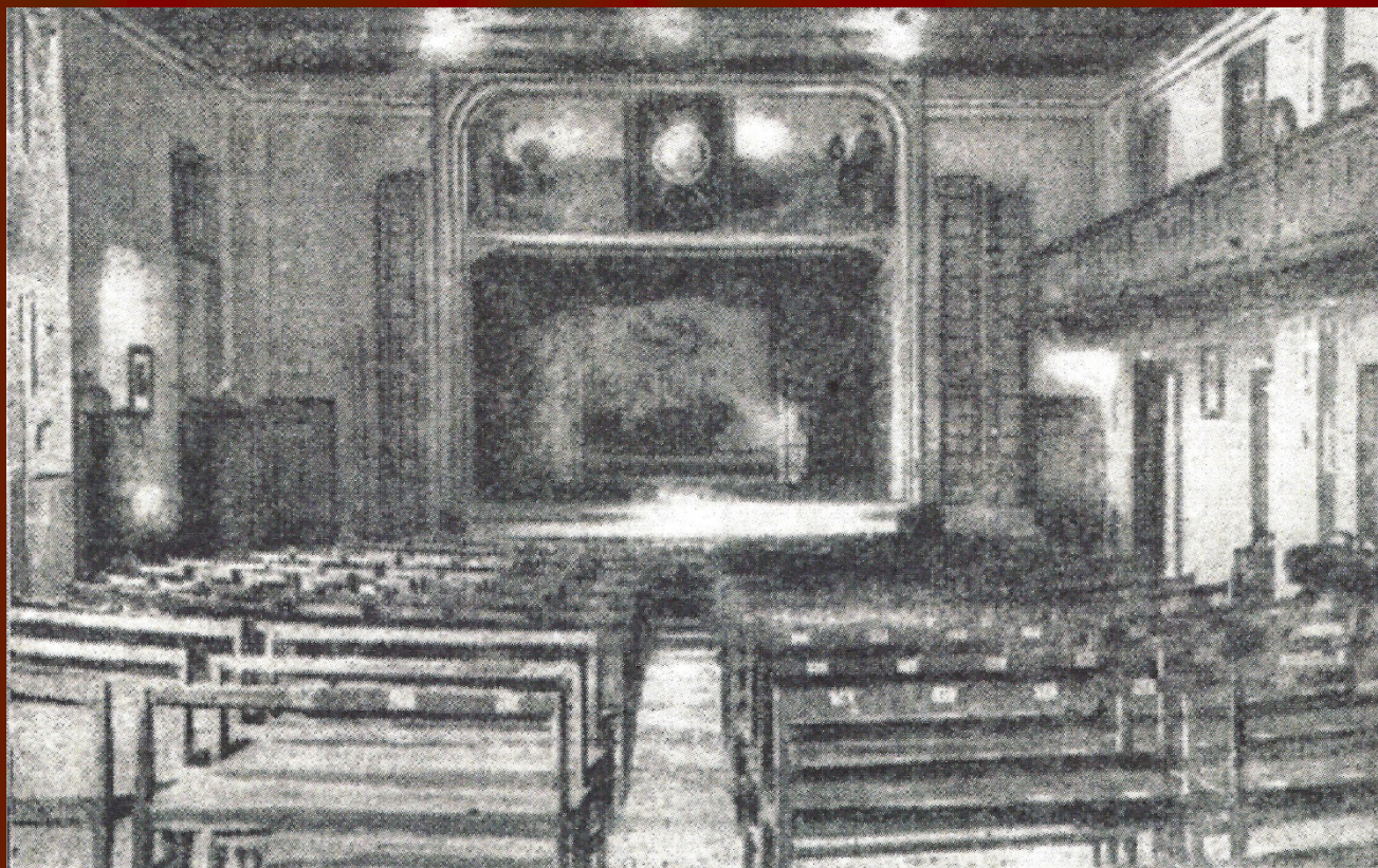
Časopisna fotografija Sokolskega gledališča v Radovljici. Obj. v: Tedenske slike, 1926, št. 55 (17. dec.), str. 3.