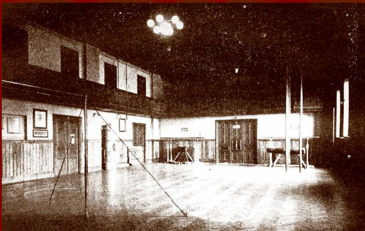
Sokolski dom v Radovljici, del dvorane s telovadnimi napravami, ok. 1932. Obj. v: Spomenica Sokolskega društva v Radovljici, 1933.