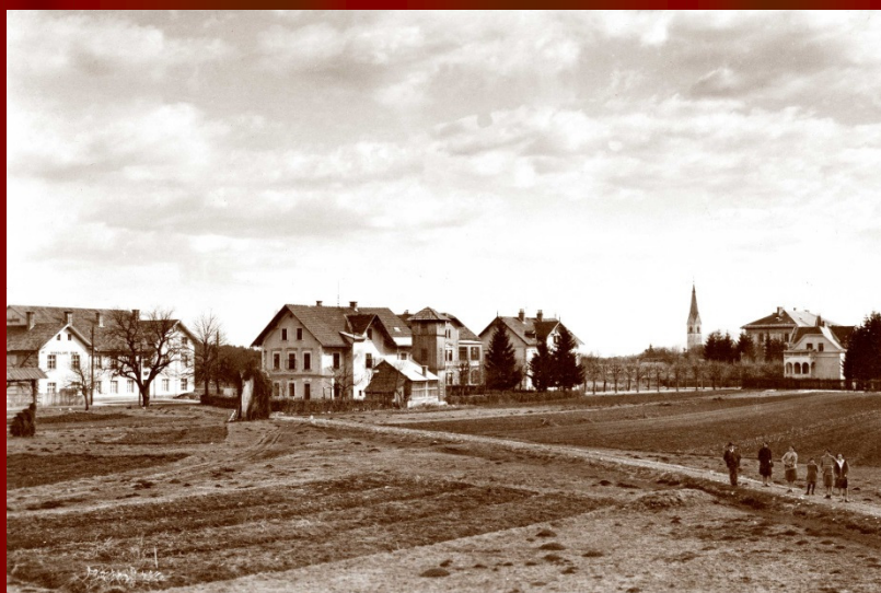
Sokolski dom v času gradnje, ok. 1921.