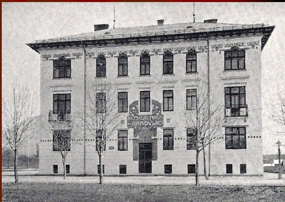
Radovljiška posojilnica ok. leta 1908. Obj. v: Illustrierten Bäder- und Reisezeitung, Dresden 1908.