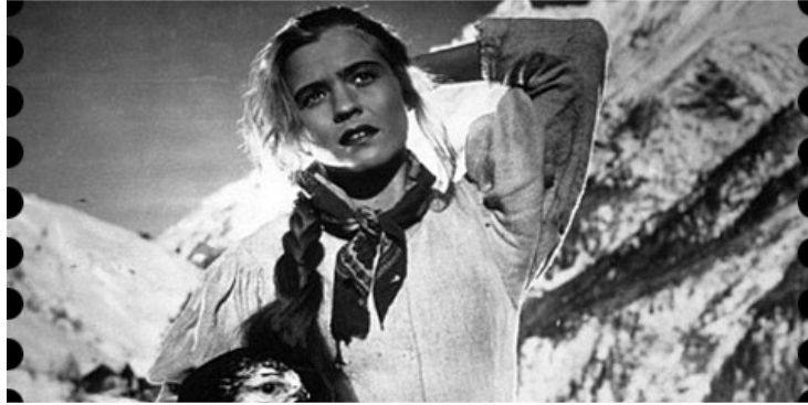
Geierwally (film iz leta 1940); to je tista učiteljica, ki je imela raje svojega ljubeznivega orla kot postavnega lovca.

Zdaj lahko dobimo posamezne slike iz tega filma celo na spletu, kar sem ugotovil pri pisanju tega sestavka.