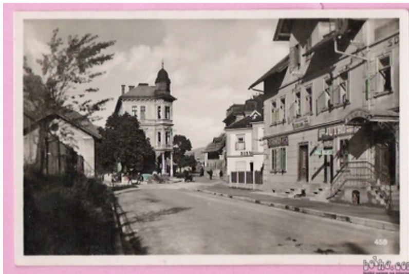
Spomin na njegovo veličanstvo, na mogočno stavbo - Hotel Triglav z značilno kupolo na vrhu (slika 1940).