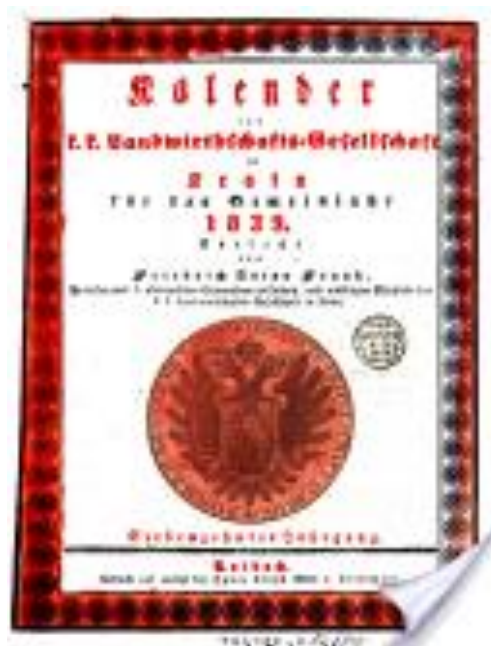
Koledar za leto 1839.