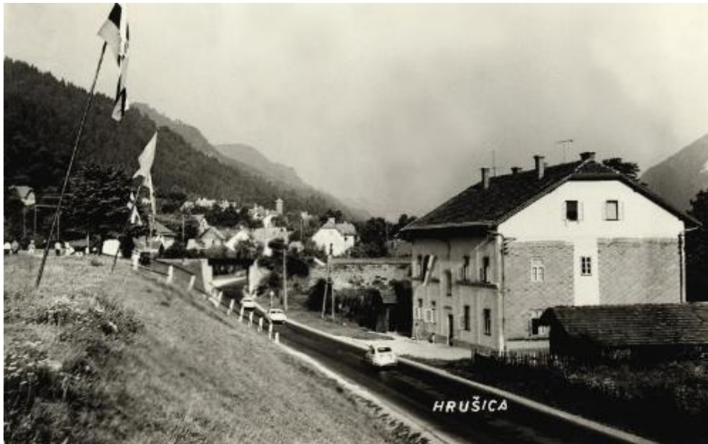
Pogled na Hrušico od zahoda proti vzhodu (proti Jesenicam); desno - železničarska hiša, imenovana Restavracija, levo - del dvignjene ravnice (razsežnega travnika), kjer stojijo ljudje, je del Placa. Vidna sta most železnice, ki pelje v Karavanški predor, in pod mostom cesta Kranjska Gora-Jesenice (slika iz leta 1949); objavila Občinska knjižnica Jesenice. Vir: Splet.

Naša baraka je bila v nizu barak od Vile proti vzhodu zadnja. Mejila je z žično ograjo, ki jo je postavila vojska. Od tu sem pogosto opazoval, kaj se dogaja na Placu in v zasedenih vojaških hišah. Marsikaj sem videl in slišal, česar pa ne bom javno povedal. Ostane zakopano.