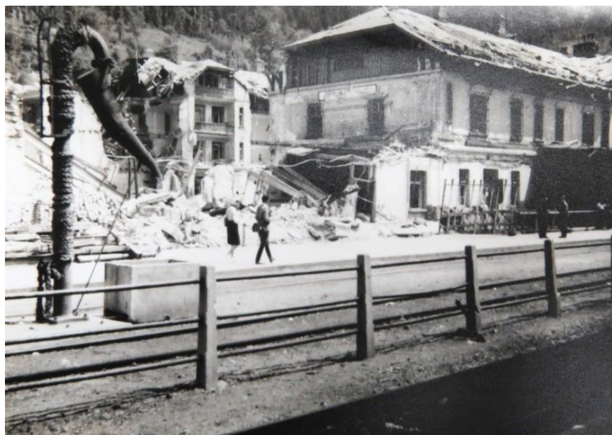
Železniška postaja Jesenice po bombardiranju 1.3.1945. Zadaaj vidimo porušeno hišo, v kateri smo stanovali. Vidno je celo, kje je bilo naše bivše stanovanje (gl. drugo nadstropje hiše, balkon z vrati v kuhinjo še stoji, vse tri sobe desno pa ne, ker je tja padla bomba).

Nekaj dni po bombnem napadu smo vsi trije odšli na Jesenice. Veliko razdejanje. Od Gostilne Baloh proti železniški postaji je bilo na levi strani veliko porušenega, tudi na desni, od tega Pavlinova hiša, Hotel Triglav, nato postaja in železniške hiše ob njej, Gostilna Paar itn. Za vedno sem si vtisnil v spomin sliko porušenih Jesenic. Po ogledu ruševin smo se pri postaji, ko smo videli porušeno hišo, v kateri smo stanovali, zagrenjeni takoj obrnili in jo hitro mahnili peš nazaj na Hrušico v varno zavetje stare Vile, čeprav niti ni bila tako varna, saj smo se njeni stanovalci vedno bali, kdaj se bo sesula. Že če so v daljavi padale manjše bombe, se je hiša tako zelo tresla, da smo tisti, ki smo bili ob alarmih v kleti, mislili, da se bo sesedla in nas dobesedno pokopala pod seboj. A je zdržala vse okupacijske pretrese in še več. Svojemu namenu je po okupaciji služila še dobrih 40 let, nakar so jo podrli.