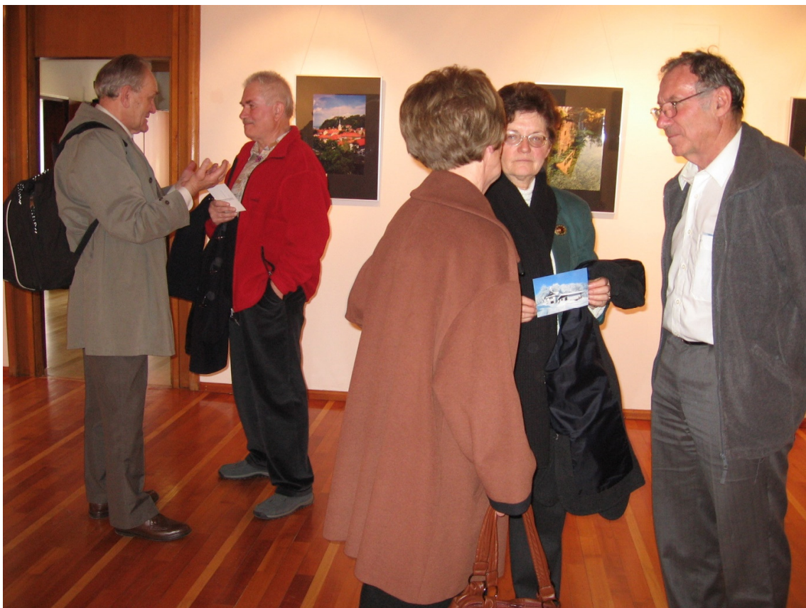
Še en spomin ob odprtju razstave 16. 4. 2008, ob 12. uri, v Galeriji Mestne občine Kranj.