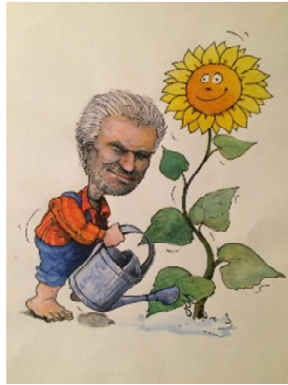
Ilustriral Edo Podreka, 2002

Prav tako Strelec meri s puščico naravnost v Škorpionovo srce, ki ga simbolično predstavlja rdeča zvezda Antares na poletnem zvezdnem nebu. S tem želi preprečiti, da bi Škorpion prišel na drugo stran neba v bližino Oriona, kjer bi utegnil junaškega lovca še enkrat strupeno pičiti in ga tako še enkrat pokončati. To pa se ne sme zgoditi, za kar noč in dan skrbi Strelec s svojo natančno in strupeno puščico.