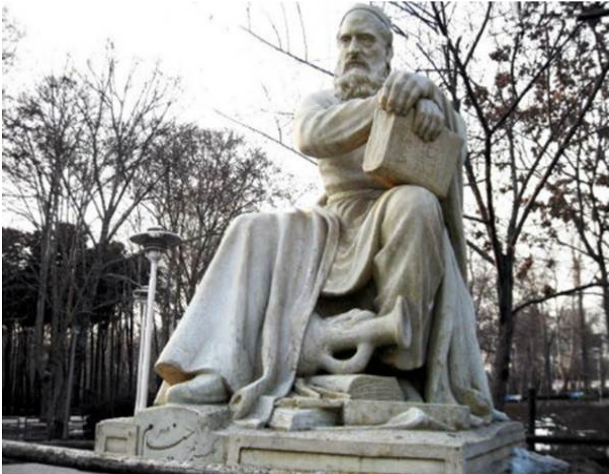
Spomenik Omarju Hajamu v Isfahanu.

Zelo neznaten sem; veste, ničesar ne razumem, jasno mi ni niti to, kdo in čemu sem tu.