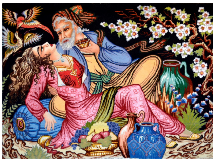
Značilni rubajamski trikotnik: vino, ljubica in On.