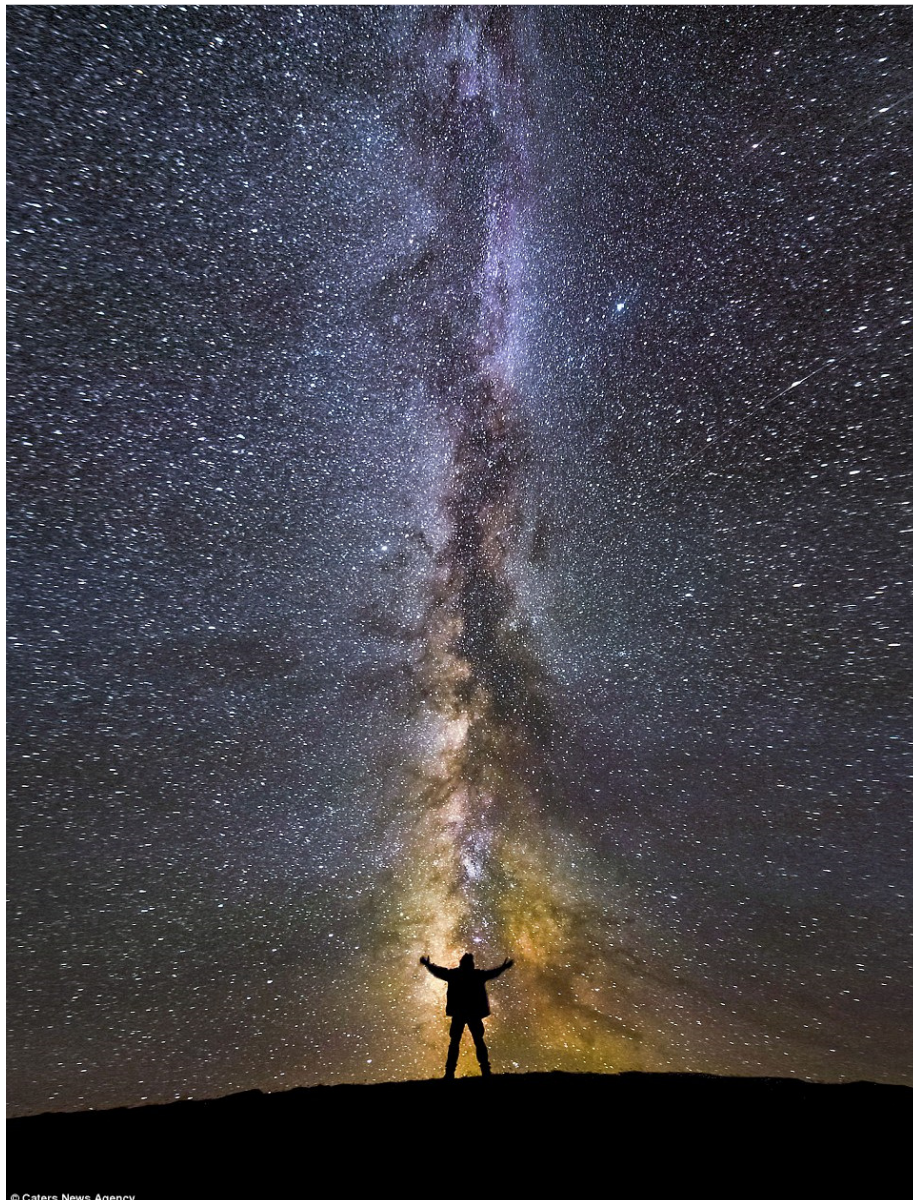
Rimska cesta pred njim; pogled proti središču naše Galaksije, ki leži v ozvezdju Strelec.

V Rimski cesti so ljudje videli najrazličnejše stvari: pas (latinsko Caeli Cingulum - Nebesni pas), trak (tako jo imenuje Ptolemaj), sukanec ali vrh, šiv, špranjo, steber, hrbet, kačo, žarek (sončni pri Poljakih, mlečni pri Nemcih), oblak, mrežo (zvezde so ribe v mreži), drevo (zvezde so listi) itn.