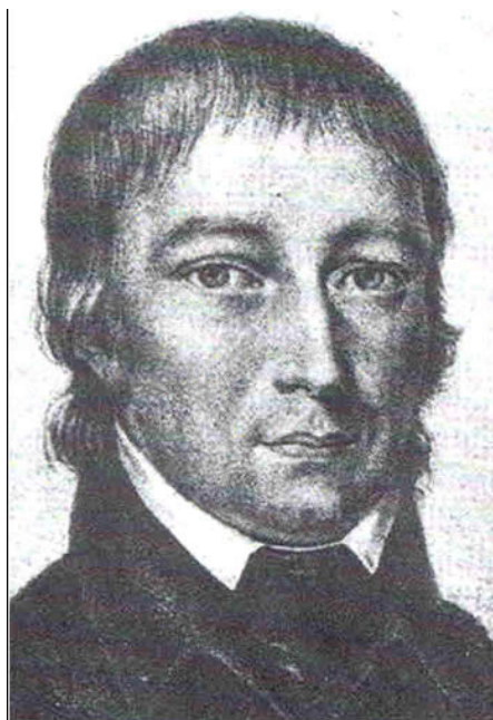
Valentin Vodnik (1758–1819).

Zaenkrat menimo, da je prvi poljudni spis iz astronomije v slovenskem jeziku prispeval naš prvi pesnik Valentin Vodnik. Gre za nekakšno poročilo V. Vodnika, ki je s teleskopom opazoval zvezdno nebo. Spis je izšel v sredo, 14.2.1798 v Lublanskih novicah in nima kakšnega posebnega naslova. V glavnem piše nekaj o kometih in o opazovanju Venere z daljnogledom. V arhivu NUK v Ljubljani ga najdemo pod naslovom [ O repatici ].