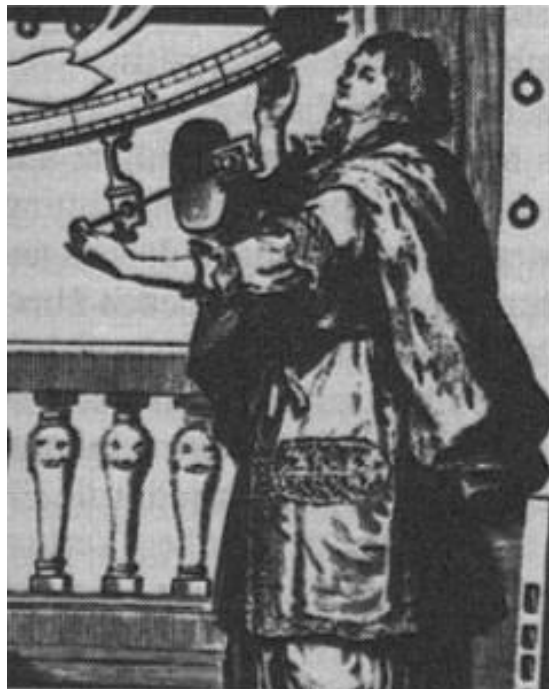
Elisabetha Hevelius (1647–1693) pri opazovanju z doma narejenim sekstantom (del obširne gravure).

Po številnih študijskih potovanjih po Evropi se je Hevelij naposled vrnil domov v Gdansk (1634), da pomaga pri vodenju družinske pivovarne. Leta 1636 se je oženil z dve leti mlajšo Katharino Rebeschke, hčerjo bogatega meščana Gdanska. Katharina je opravljala večino administrativnega dela v zvezi s pivovarno, tako da se je Hevelij lahko posvečal astronomskim opazovanjem, brušenju leč za daljnogleda, konstruiranju astronomskih opazovalnih naprav, izdelavi kvadrantov, sekstantov in drugih inštrumentov za odlično opremljeno zvezdarno, ki jo je začel graditi leta 1641. Postavil jo je na strehi svoje hiše sredi Gdanska. Vrsto let je tam opravljal različna opazovanja. Leta 1670 pa je zvezdarna pogorela, kar je Hevelija zelo potrlo in je zagotovo vzrok za njegovo prezgodnjo smrt.