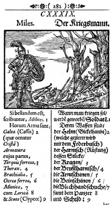
Zgleda za nebesno kroglo in za vojaka oz. vojščaka v Orbisu Pictusu .