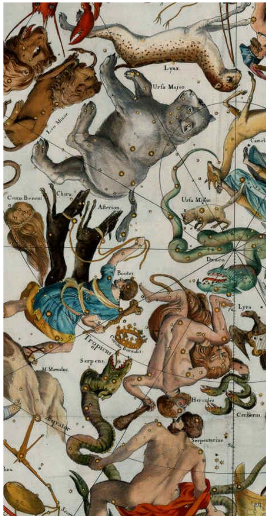
Izsek iz Hevelijevega atlasa zvezdnega neba Uranografija (Gdansk, 1690), kjer sta prikazani glavi Herakleja in Kačenosca.

Le dva od njih pa sta na nebu tako zelo blizu skupaj, da se njuni glavi skoraj dotikata. To sta največji junak grškega bajeslovja, Heraklelej, prikazan v ozvezdju Herkul, in največji mitični zdravilec antičnih časov, Eskulap, prikazan v ozvezdju Kačenosec (Ofijuh, tudi Serpentarius).