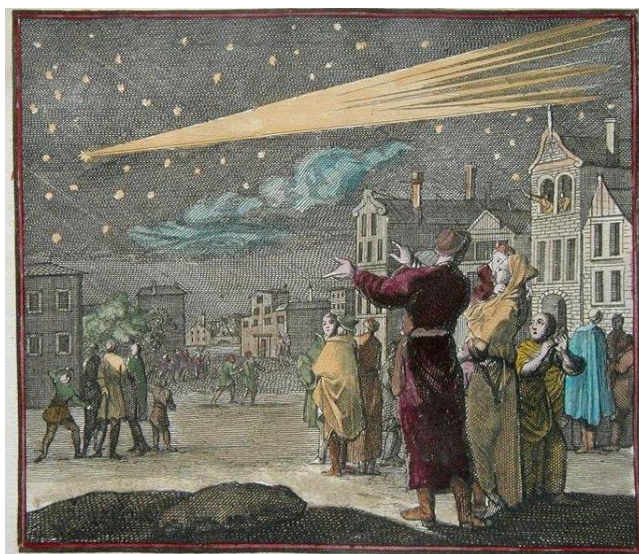
Komet leta 837 je bil Halleyjev komet.

Leta 837 se je na nebu pojavil košat in svetel komet. Francoski kralj Ludvik Pobožni se ga je prestrašil. Svojega dvornega astrologa je v strahu vprašal, če komet oznanja, da bo v kratkem prišlo v državi do zamenjave kralja.