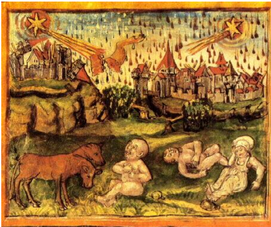
Komet leta 1456, imenovan Komet črna smrt, je bil tudi Halleyjev komet.

Komet je kmalu nato brez sledu izginil. Do prelivanja krvi ni prišlo.