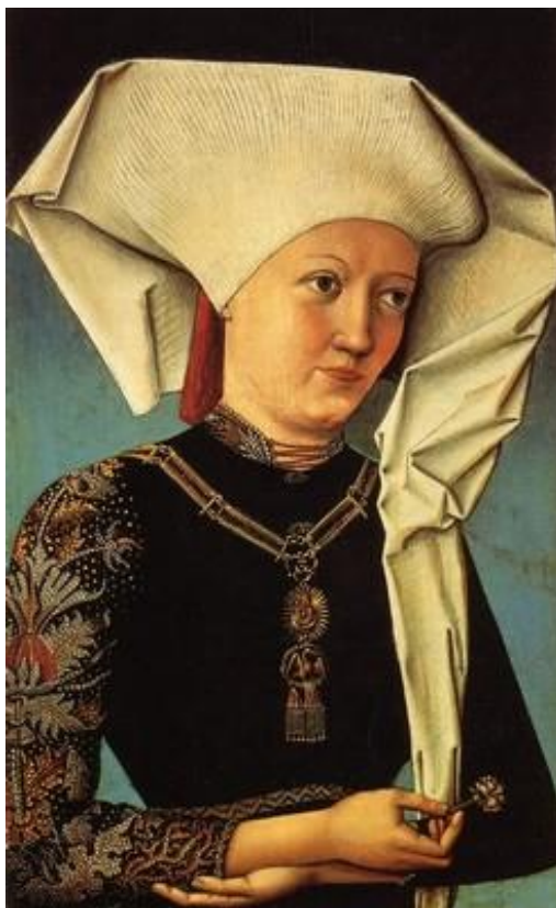
Ema Krška (? , okoli 980 – Krka, danes Avstrija, 1045).

Ema (Hema) Krška, nemško Hemma von Gurk, je bila koroška kneginja in svetnica. Trdnega zgodovinskega dokaza, kdaj se je rodila in kakšnega rodu je bila, nemškega ali slovenskega, ni. Takrat v ljudeh še ni bilo kakšne zavesti o narodni pripadnosti. Izhajala naj bi iz grofovske rodbine in naj bi se po ljudskem izročilu rodila na gradu Pilštanj na Kozjanskem, kjer so imeli njeni starši dedno posest. Čeprav je bila plemiškega rodu, se je počutila domačo med preprostimi in revnimi. Mlado Emo Pilštanjsko so starši poslali na nemški dvor, da bi se naučila uglajenega vedenja in da bi se primerno izobrazila.