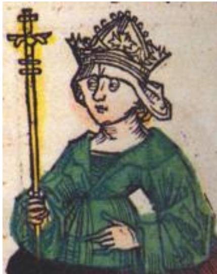
Barbara Celjska (Celje, 1382 – Mělník, Češka, 1451).

V Celju je preživela samo najzgodnejša otroška leta. Najkasneje ob poroki leta 1405, morda pa že ob zaroki s Sigismundom leta 1401 je zapustila mesto ob Savinji in se vanj ni nikoli več vrnila. Zato o njenih najzgodnejših letih vemo le malo, ali skoraj nič. Verjetno so jo od leta 1401, ko je bila sklenjena njena zaroka, pripravljali na vlogo kraljice.