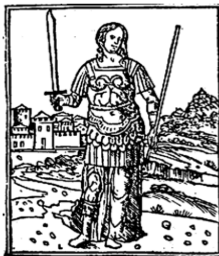
Kraljica Semiramida, prikazana kot oborožena vojščakinja, italijanska ilustracija iz 18. stoletja.

Semiramida (gr. Semiramis, asir. Samuramat) je ime asirske vladarice (kraljice), ki je zaslovela predvsem po zaslugi starogrških zgodovinarjev. O njej so napletli številne legende. Šele raziskave na začetku prejšnjega stoletja so jo postavile na pravo mesto v babilonsko-asirski zgodovini. Domnevajo, da naj bi vladala od 810 do 782 pr. n. št. Vendar pa se navedene letnice njenega vladanja po različnih avtorjih razlikujejo med seboj (gl. dalje). Upoštevamo tiste, ki so večinoma navedene v določenem stoletju. Vsi življenjepisi, ki so jih o njej napisali Diodor Sicilski in drugi naj bi bili nezanesljivi, celo napačni. Njihova Semiramida je bolj legendarna kot resnična osebnost.