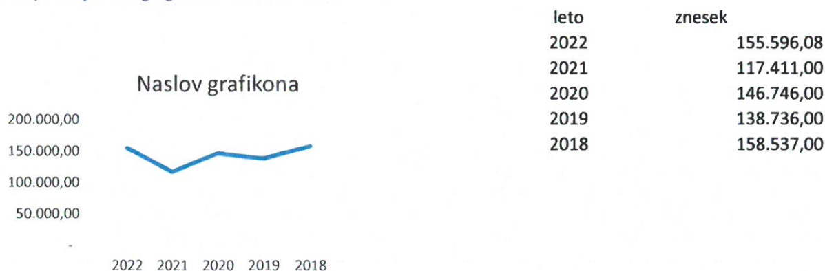
Graf: Odpis knjižničnega gradiva od 2018- 2022

Razen serijskih publikacij se od leta 2018 knjižno gradivo odpisuje po dejanski vrednosti, pred tem po pavšalu.