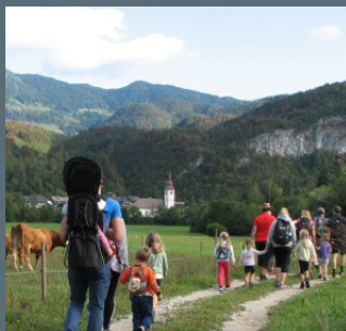
Družinski pravljичni pohod na Ajdovski gradec.