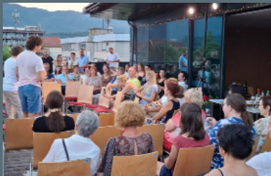
Spontana komedija na terasi Knjižnice Radovljica.