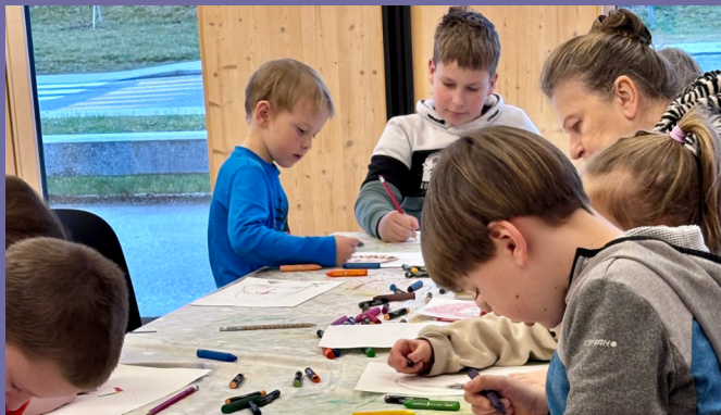
Slikarske delavnice, Knjižnica Blaža Kumerdeja Bled.

Obveščamo vas, da so vsi dogodki v naših knjižnicah javni in bodo snemani. Fotografije in posnetke lahko uporabljamo v promocijske namene, vključno z objavo na naših uradnih kanalih. Skladno s Pravilnikom o varstvu osebnih podatkov z udeležbo na dogodku soglašate s snemanjem in uporabo vaših slik.